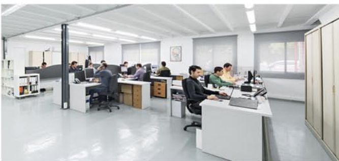
Máxima adaptabilidad al cliente.