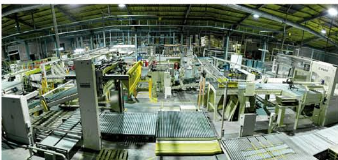
Tecnología punta y especializada.