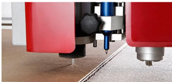
Expertos en innovación y diseño.